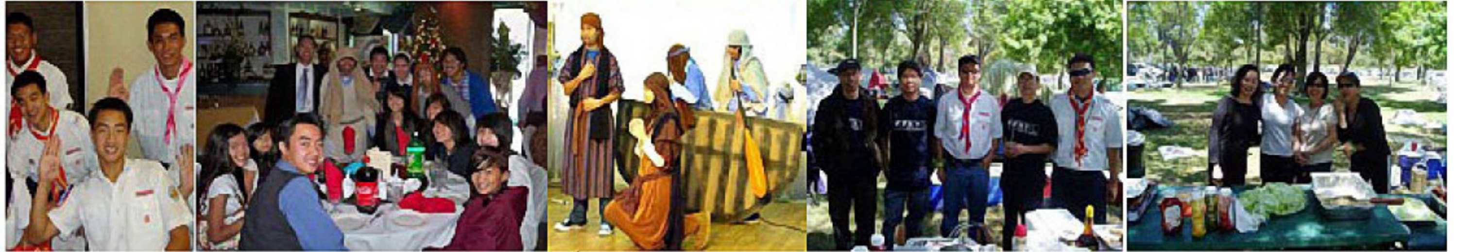
Sinh hoạt Cộng Đoàn Ôn Thiên Triệu và TNTT Lê Bảo Tịnh những năm về trước.....Trơ Tả TNTT.....Phụ Huynh... wonderful year